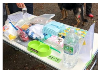
避難リュックの中味