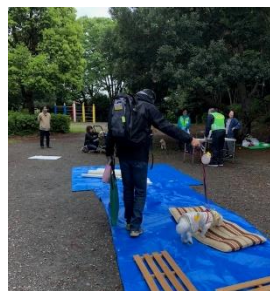
リュックを背負って 悪路体験

★ 飛び入り参加の飼い主さんから ★ 今日、たまたまこの時間に来て良かったです。勉強になりました。実際、避難リュックを背負って、こういう経験も初めてでしたので、体験させてもらい有難うございました。