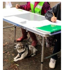
最後にアンケート